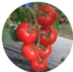
Artiglio (CRX 78251) F1