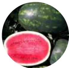
Magenta (CRX 10144) F1