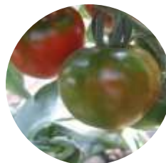
CRX 75143 F1