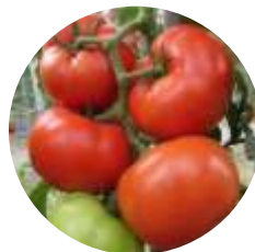
CRX 78502 F1