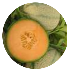
CRX 80001 F1