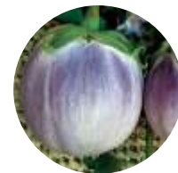
Rotonda Bianca Sfumata di Rosa