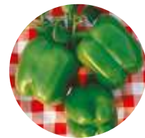
Yolo Wonder (TMR)