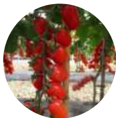
Scaltro (CRX 75551) F1