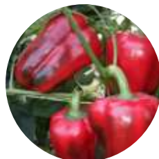
CRX 61035 F1