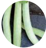
Lungo Tortarello Chiaro (Cucumis fleuosus)