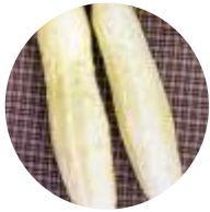
Mezzo Lungo Bianco