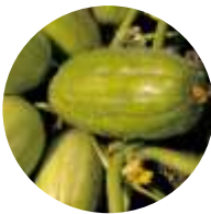
Pepino Melão Barese