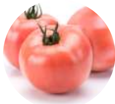
Pink Wave F1