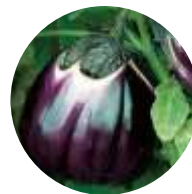
Violetta di Firenze