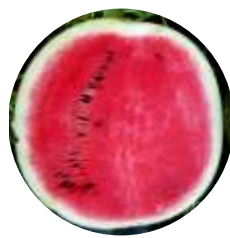
Bomber (CRX 10142) F1