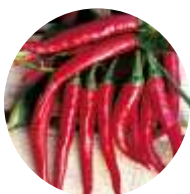
Picante di Cayenna (tipo picante)