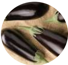
Nabucco (CRX 50133) F1