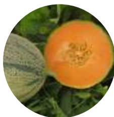
Kiros (80002) F1