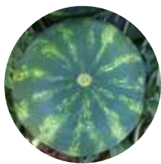
Bond (CRX 10007) F1