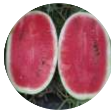
Romina (CRX 10190) F1