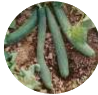
Lungo Tortarello Verde Scuro (Cucumis fleuosus)