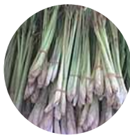
Erva Príncipe / Lemongrass