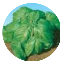
Manjeriçao Tipo folhas frisadas