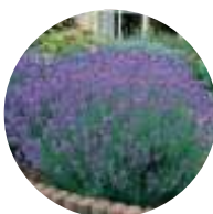
Alfazema / Lavanda