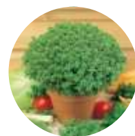
Manjerico / Manjeriçao Grego